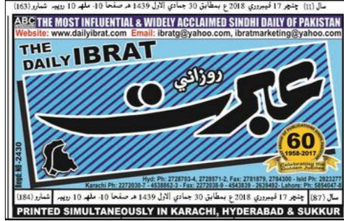
Daily Ibrat On 17th February, 2018